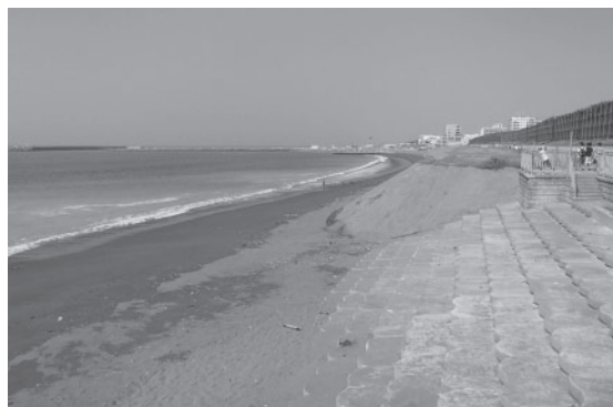
養浜（茅ヶ崎市中海岸）