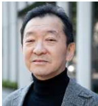
講演 ジャーナリスト 高世仁氏