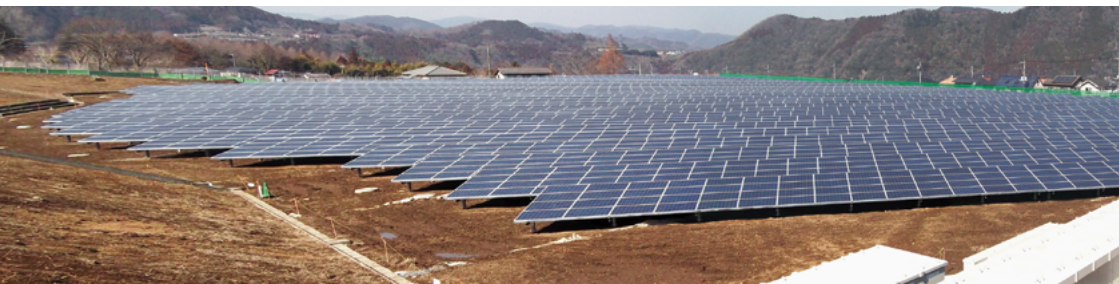
愛川太陽光発電所(愛称「愛川ソーラーパーク “さんてらす TOBISHIMA”」)