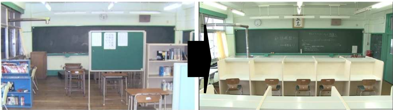
横須賀高等学校自学自習教室整備（平成25年度）