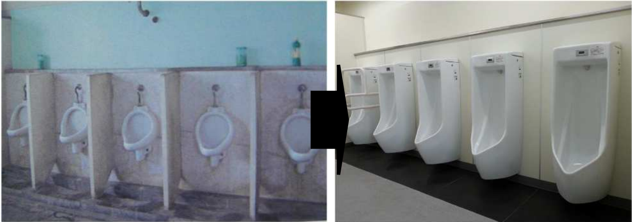
大和高等学校トイレ改修（平成25年度）