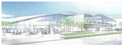
A 新港湾管理事務所(イメージ図)