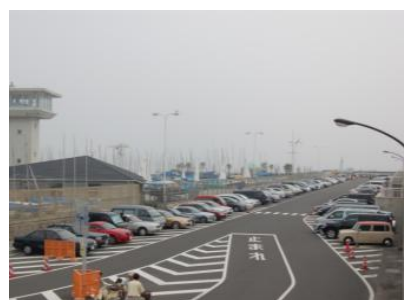
F 臨港道路附属駐車場