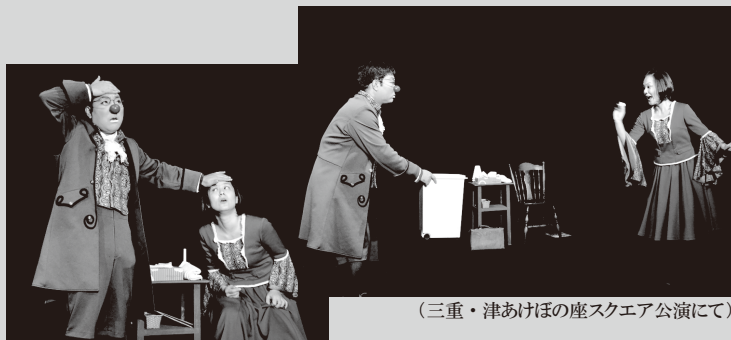
（三重・津あけぼの座スクエア公演にて）