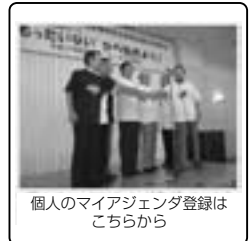
個人のマイアジェンダ登録はこちらから