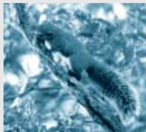
台湾リス（台湾南部原産） 樹をかじる台湾リス。樹や家の戸袋をかじる被害も出ています。

アライグマ（北アメリカ原産） 家の屋根裏などに巣を作るアライグマ。 可愛い顔してかなりどう猛。