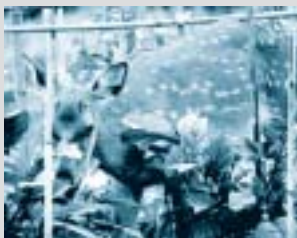
ニホンジカ 畑でナスを食べるシカ。