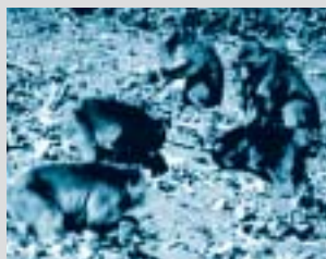
ニホンザル 畑でダイコンを食べるサル。