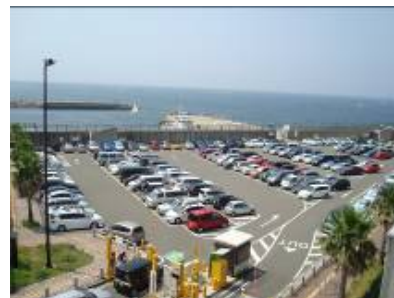
F 臨時道路附属駐車場