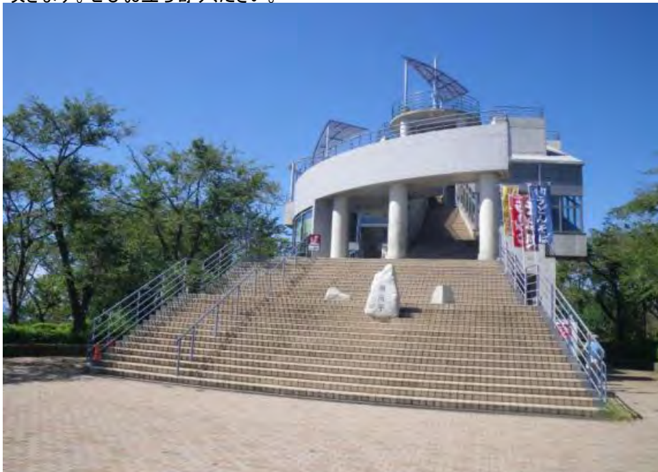
高麗山公園レストハウスです。展望レストランとして多くの人々が利用しています。

ハイキングや夜景等で多くの人々が訪れる湘南平にあります高麗山公園レストハウスです。この施設は展望レストランとして建設しました。おすすめ箇所は屋上からの眺めです。平塚市内はもちろん湘南の海が一望できます。空気が澄んでいれば施設に付属してあります双眼鏡等で東京タワーやスカイツリー、都庁まで見ることが出来ます。また春には約2000本の桜(ソメイヨシノ、オオシマザクラ、ヤマザクラ、サトザクラ)が咲きます。ぜひお立ち寄りください。