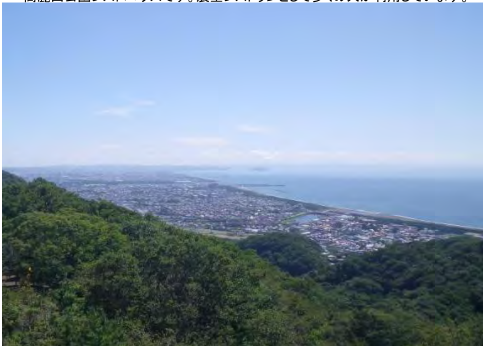
湘南の海が一望できます。施設に付属している双眼鏡等でスカイツリーが見られます。