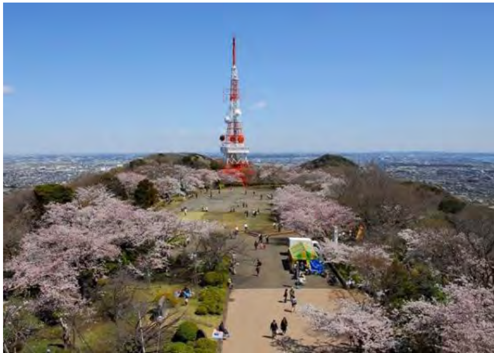
神奈川の景勝50選の地で桜と展望夜景の名所です。 3月下旬から4月上旬にかけて約2000本の桜が咲き例年多くの人で賑わいます。