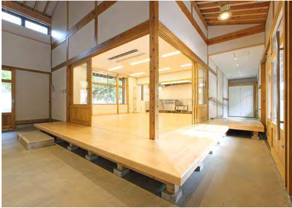
体験棟 エントランス