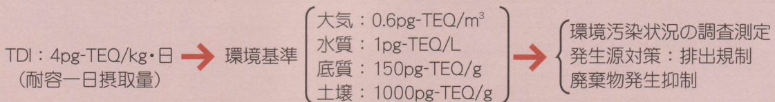
図3 ダイオキシン対策の基本となる基準

したがって、国や県等の行政機関が行う様々なダイオキシン対策においては、基本となるこれらの数値レベルを達成するように、発生源対策や環境汚染状況の調査測定等の対策を進めることとなっています（図3）。