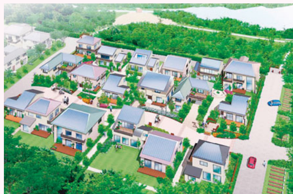
かながわエコ・エネルギータウンイメージパース