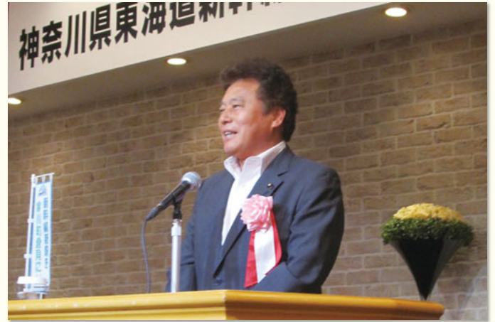
持田県議会議長ご挨拶