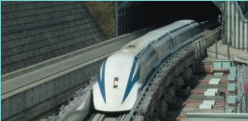
山梨リニア実験線