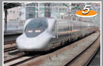
ひかりレールスター（2000年～運行）