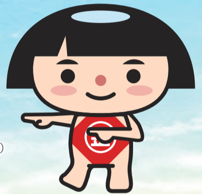
神奈川県PRキャラクター かながわキンタロウ