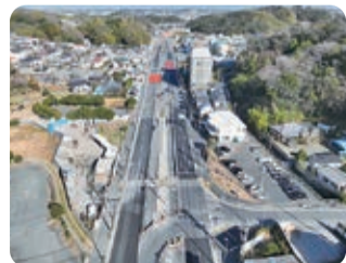
幹線道路(横浜藤沢線)