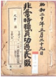
横浜大空襲時の県職員の活動が記録された公文書

●期間:1月23日～3月29日 ●内容:昭和初期から終戦までに作成された神奈川の公文書・私文書を中心とした展示 ☎☎045(364)4461 ☎月曜、2月11・24日