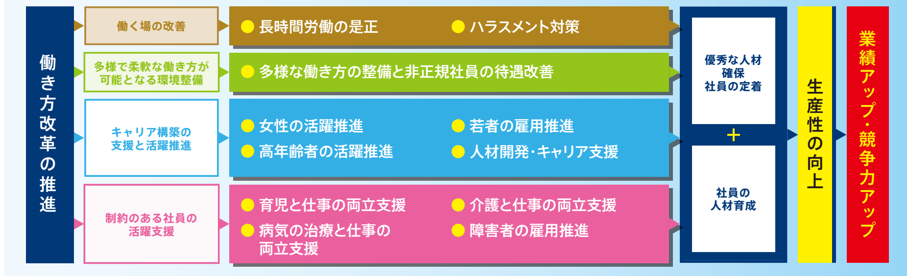
働き方改革 取り組み項目 体系図

働 く人がそれぞれの事情に応じた多様な働き方を選択できる社会を実現するために、働き方改革の取り組みを進めています。この取り組みにより、少子高齢化による労働人口の減少や長時間労働といった課題が解決され、企業の人材確保や生産性向上につながることを期待されます。