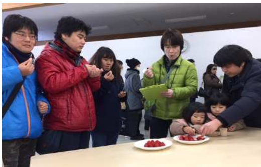
【ひらつか花アグリ冬の収穫祭】 イチゴの品種当てクイズを実施(1/15)