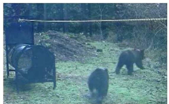
〔クマの学習放獣(人が怖いことを学習させる)〕