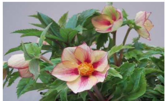
【クリスマスローズ展~そのルーツをたどる~】 主にヨーロッパが原産地。原種から交配種までの 展示会(2/4~12)と講演会(2/5,12)を開催