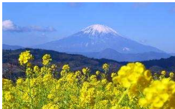
吾妻山公園「早咲き菜の花と富士山」(1月)