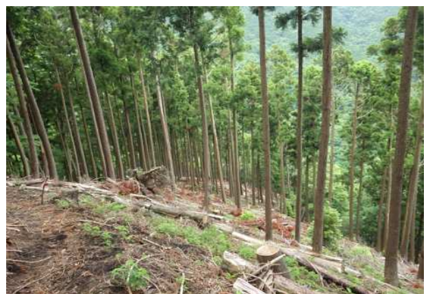
間伐実施後の森林内