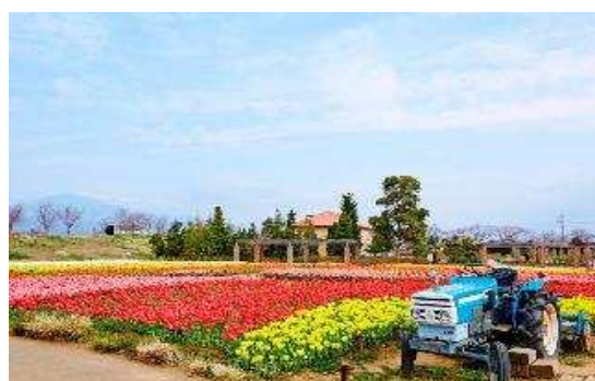
花菜ガーデン「春チューリップ」(3月)