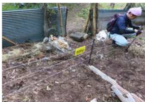
〔クマ対策用の電気柵の設置〕