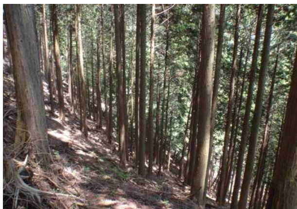
間伐実施前の森林内