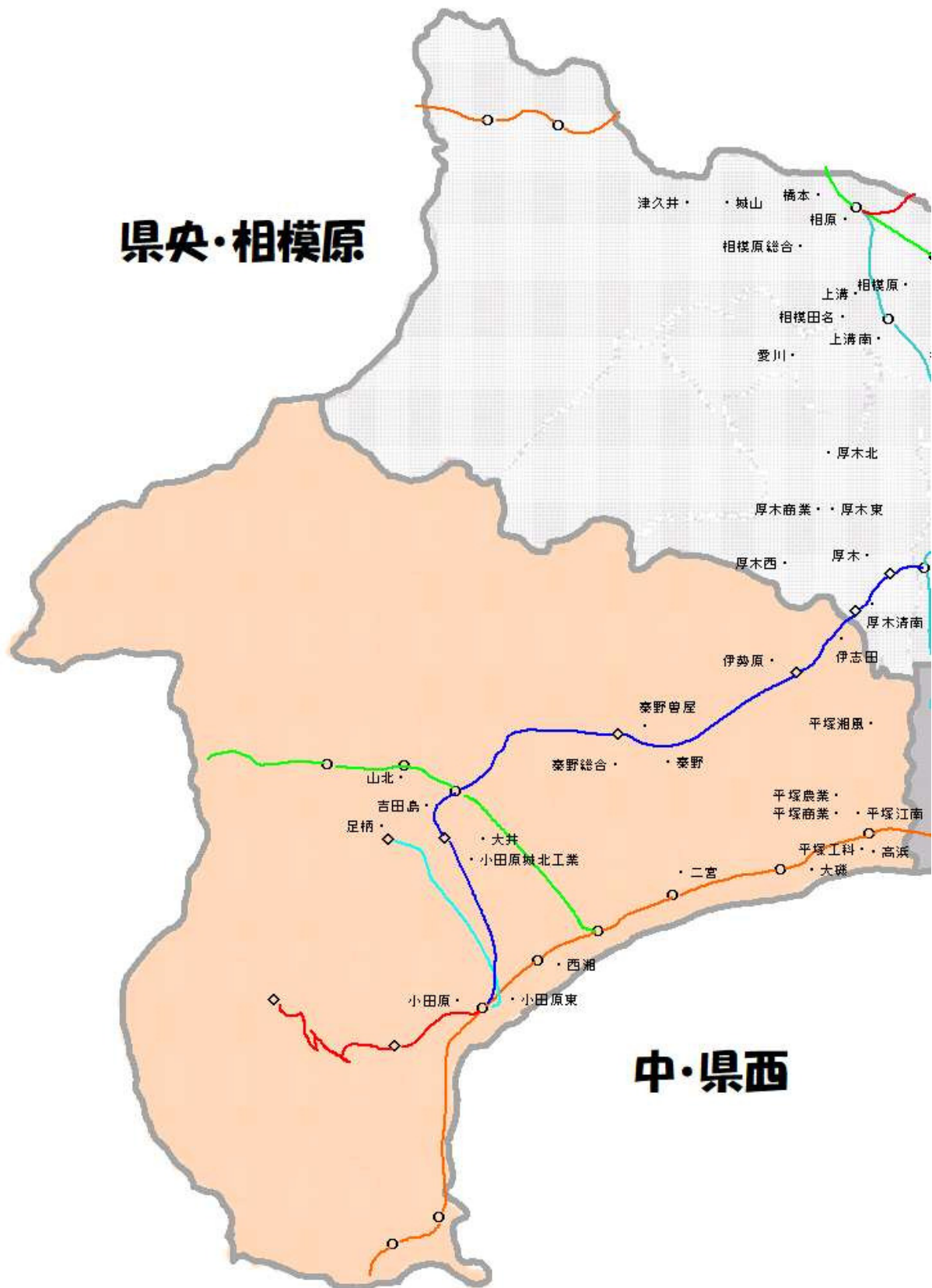
【参考図表 1】 5つの地域と現在の公立高校の配置状況（平成30年4月現在）