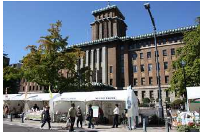
会場の様子（県庁前）