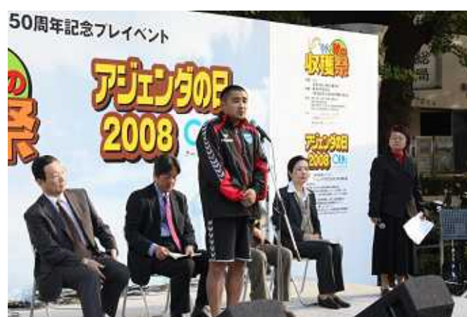
一村一品・知恵の環づくり 県代表発表