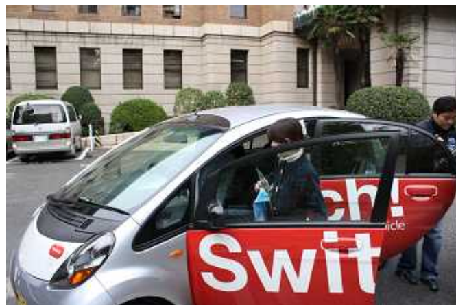
電気自動車同乗体験コーナー