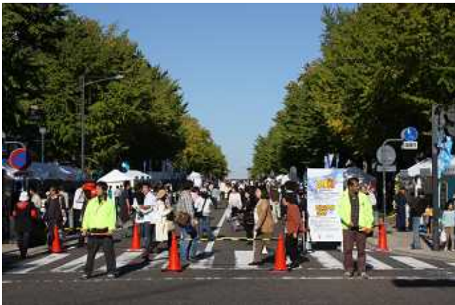
会場の様子（横浜公園付近）