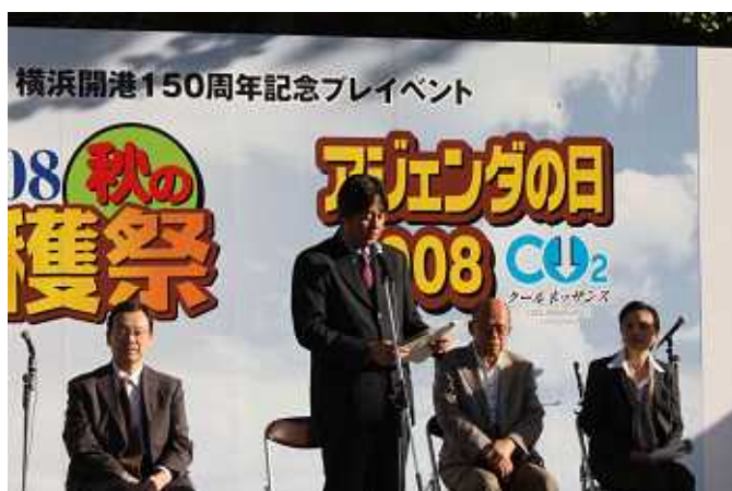
一村一品・知恵の環づくり 県代表発表