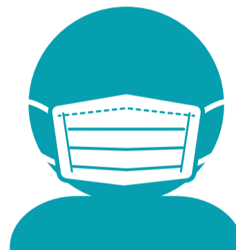
場に応じたマスク