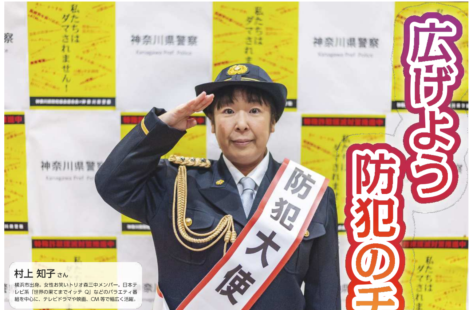
村上 知子 さん

横浜市出身。女性お笑いトリオ森三中メンバー。日本テレビ系「世界の果てまでイッテQ」などのバラエティ番組を中心に、テレビドラマや映画、CM等で幅広く活躍。