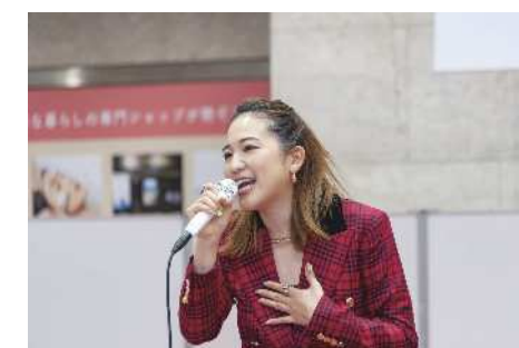
▲シンガーソングライター山口紗矢佳さんによるミニライブ

横浜市出身。女性お笑いトリオ森三中メンバー。日本テレビ系「世界の果てまでイッテQ」などのバラエティ番組を中心に、テレビドラマや映画、CM等で幅広く活躍。