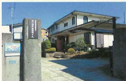
デイサービス(共生型) 大谷