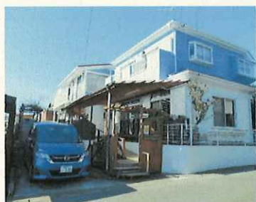
デイサービス 国分寺台