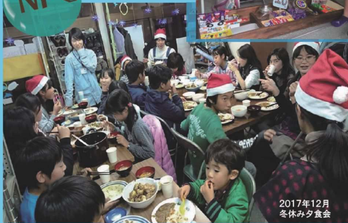
2017年12月 冬休み夕食会