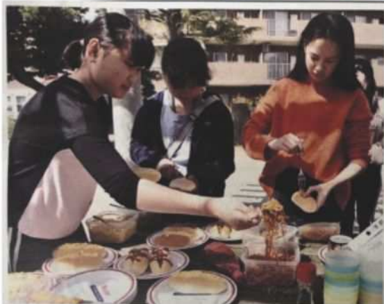
コッペパンに具材を詰める子どもたち

休校中子どもに昼食提供 給食用コッペパン食材に 新型コロナウイルス感染症拡大の影響で、給食のない子どもたちの食を懸念する声も聞かれる。市内で子ども居場所を提