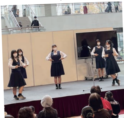
手話に関する取組発表・パフォーマンス!