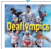
デフリンピックの紹介があるよ!