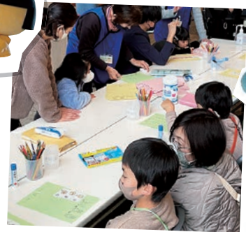
指文字ぬりえで楽しもう!