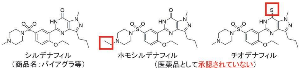
図3 承認医薬品成分であるシルденаフィルと構造類似成分の例

また、残念なことにはいわゆる健康食品の中には違法に医薬品成分を添加した商品が海外及び国内で数多く報告されています。医薬品成分が添加された商品はいくら「食品」と称していても境界線を越えて「医薬品」として区分され、違法な無承認無許可医薬品となります。適正に製造販売されている医薬品と比べ、安全性の確認や徹底した品質管理がされておらず、過去には死亡事例も含めた多数の健康被害が報告されているなど、とても危険です。また、仮に使用によって一時的な症状の改善があったとしても、本来の受診機会の喪失により適正な治療を受けられないことも危惧されます。なお、発見された無承認無許可医薬品の中には、医薬品としての使用実績のない有効性・安全性が未知の構造類似成分や開発が中止になった成分が添加されるなど、より危険な事例も報告されています（図3）。