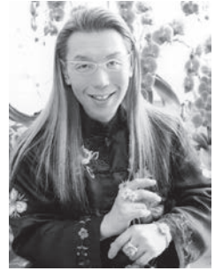
假屋崎 省吾 氏 (元祖華道家)

東京・銀座【假屋崎省吾 花教室】主宰。「美をつむぎだす手を持つ人」と評され、各国首脳来日歓迎や天皇在位10年記念、天皇退位・即位など多数の花制作を手掛ける。女子美術大学・客員教授、フランス観光親善大使、オランダチューリップ大使などを務め、花と建物のコラボ企画「歴史的建築物に挑む」を国内外で開催。「花育活動」や「少子化問題」などの社会活動も積極的に取り組み、今年、華道歴40周年を迎え、益々活躍の場を広げている。