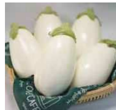
「茅ヶ崎のトルコナス」