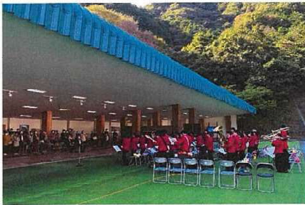
▼県内の高校吹奏楽部によるアトラクション