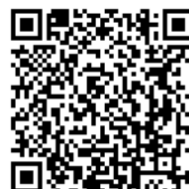
科学部科学支援課 ホームページ

神奈川県立青少年センター 科学部科学支援課 〒243-0018 厚木市中町4-16-21 プロミティあつぎビル2階 電話 046 (222) 6370・6371 (月曜休館) 県立青少年センター科学部科学支援課ホームページ https://www.pref.kanagawa.jp/docs/ch3/kagaku/index.html