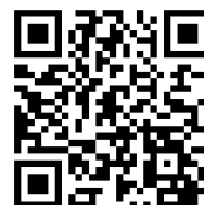
科学部科学支援課 Twitter