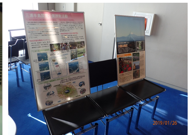
（三浦半島地域における広報活動）

三浦半島国営公園設置促進期成同盟会 神奈川県 横須賀市 逗子市 三浦市 葉山町 神奈川県市長会 神奈川県町村会 横須賀商工会議所 逗子市商工会 三浦商工会議所 葉山町商工会 事務局：神奈川県県土整備局都市部都市公園課 〒231-8588 横浜市中区日本大通1 電話：045-210-1111（代表）