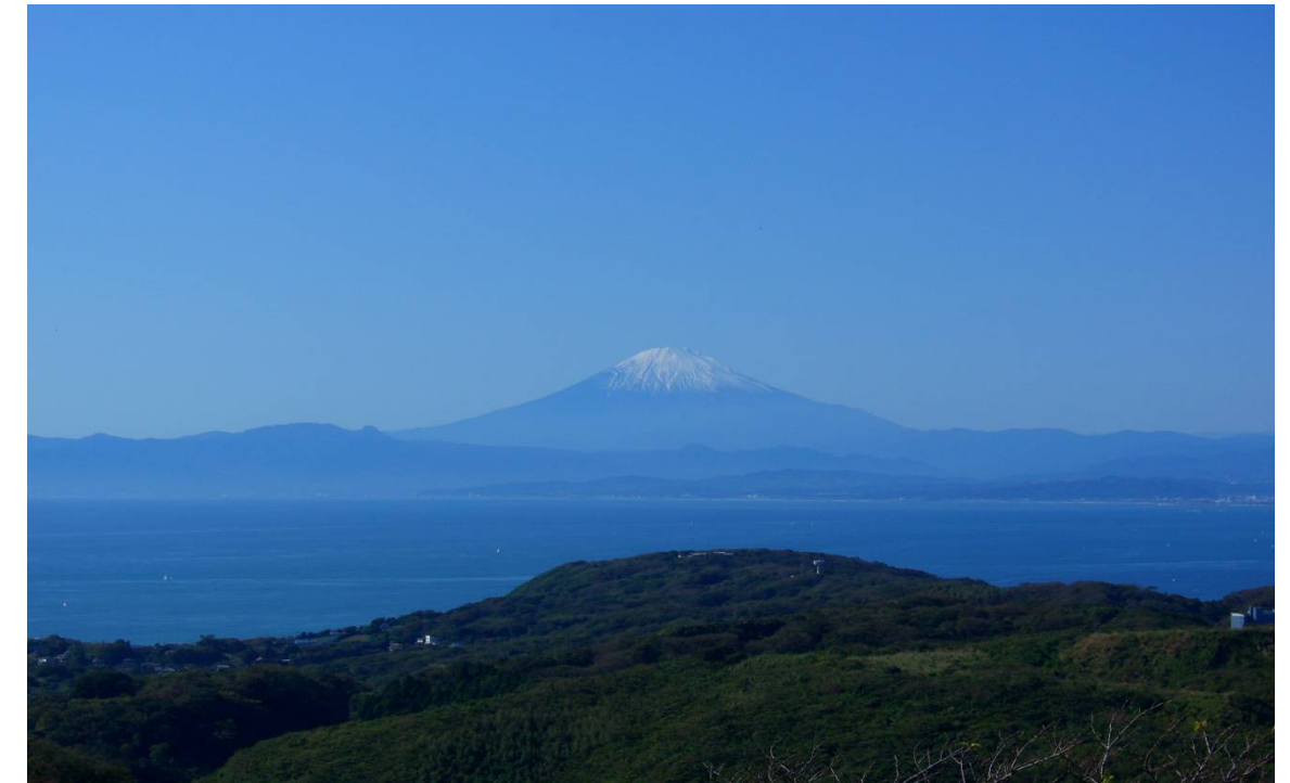
（大楠山の展望台より望む富士山）