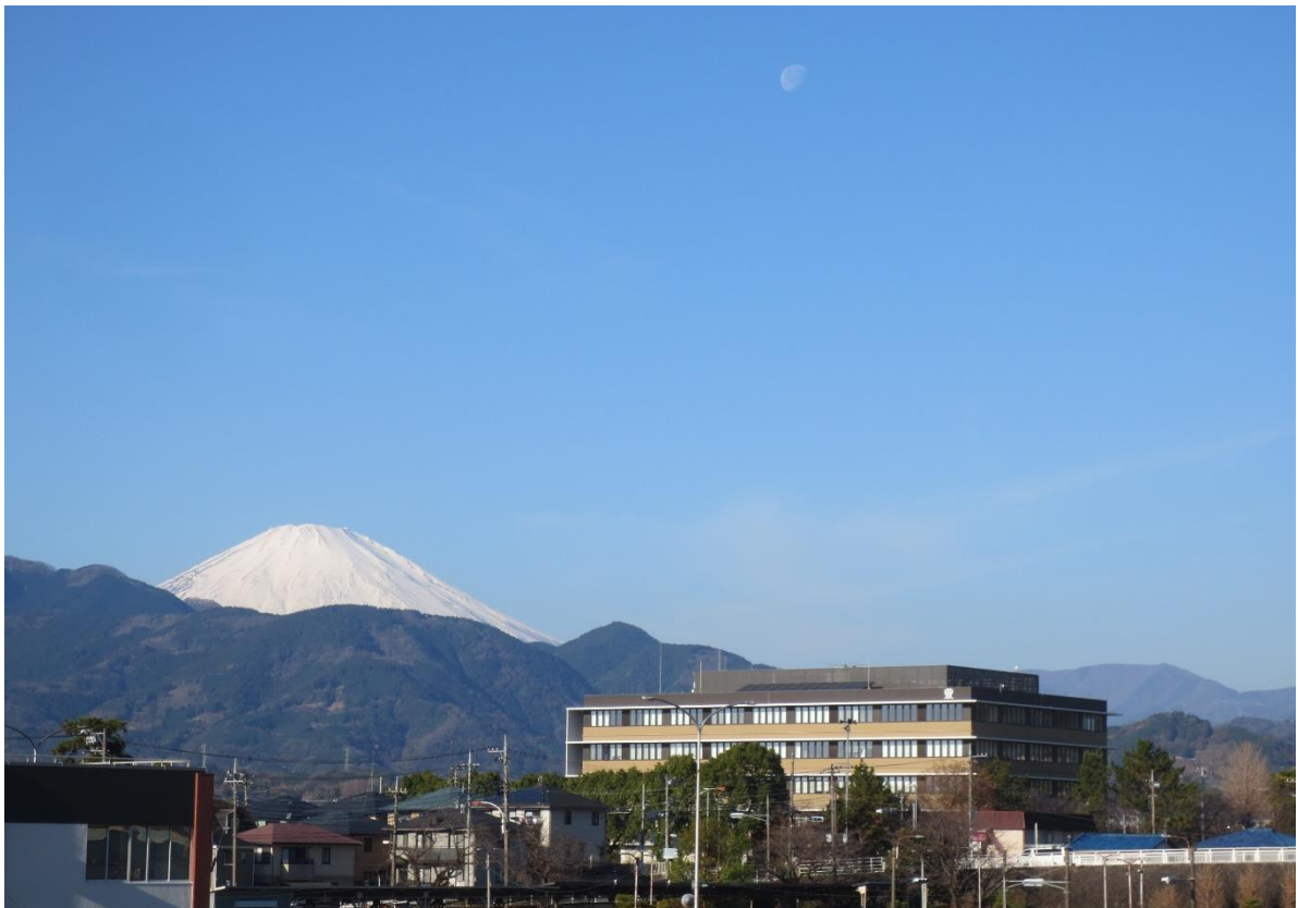
足柄上合同庁舎 （令和3年12月）