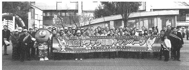
<「成人の日」街頭キャンペーンの様子>

1月11日、「成人の日」式典会場付近の新横浜駅前、川崎市とどろきアリーナ、橋本駅前、横須賀中央駅前、藤沢市民会館前で街頭キャンペーンを実施しました。好天にも恵まれ、これからを担う多くの新成人へ薬物乱用防止を訴えました。