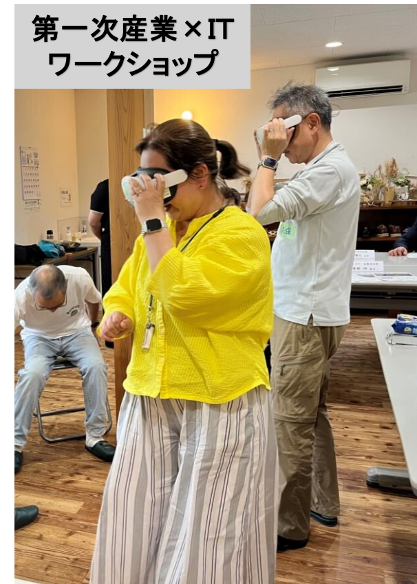
第一次産業×IT ワークショップ

3年連続、年に2回大井町で「サステナビリティ活動」として、みかん総もぎ・青みかん摘果&ポン酢作り体験を実施。