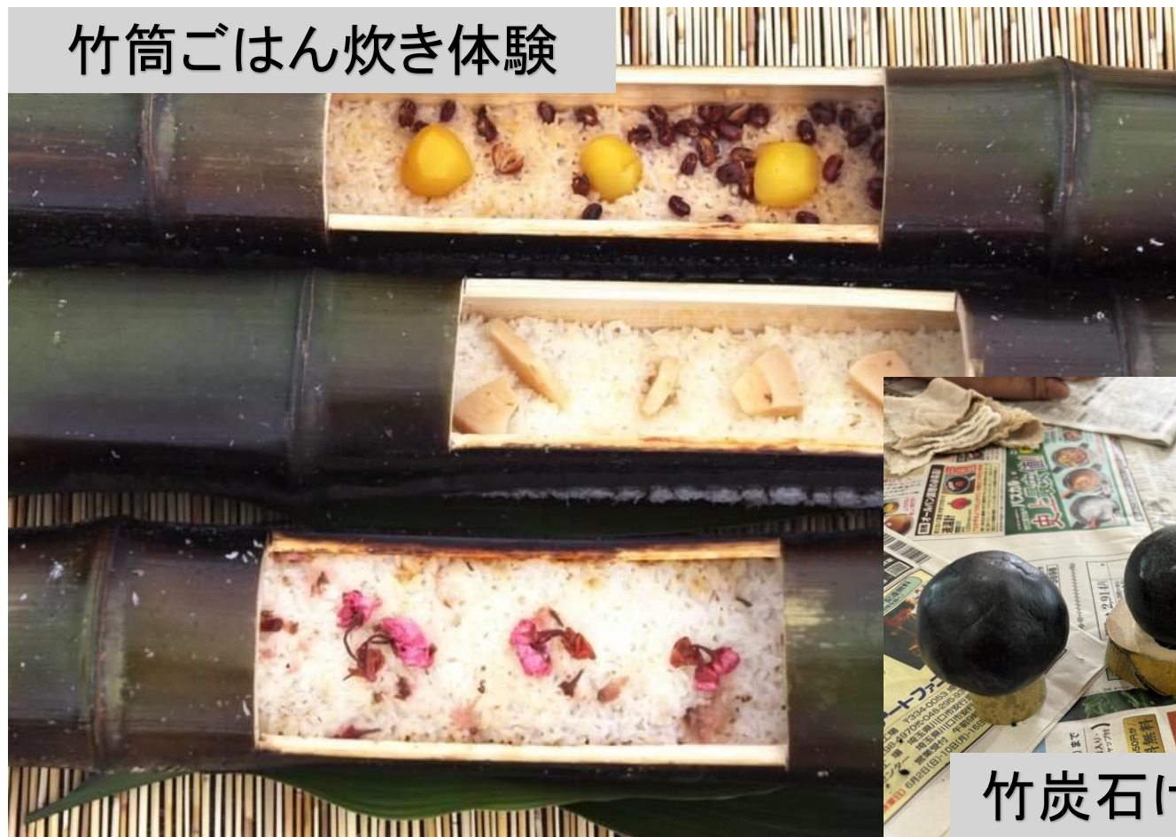
竹炭石けん作り体験