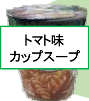
トマト味 カップスープ

インスタントのカップスープも水煮の豆を入れれば栄養価UP！たんぱく質、食物繊維が増量します