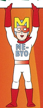
未病改善ヒーロー ミビョーマン