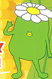
相模女子大学 学園キャラクター さがっぱ・ジョー