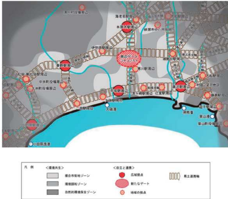
(5) 将来都市構造(イメージ図)