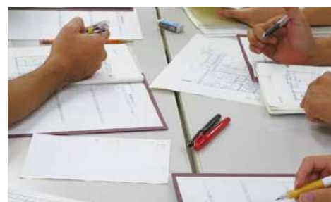
グループワーク（住宅改造改修セミナーより）