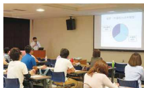
講演（脊髄損傷のリハビリテーション理解編より）

これからのリハビリテーションを担う人材を育成します。 医療・福祉・介護・教育の方々に対して、 リハビリテーションの視点からの知識・技術を伝達する研修です。