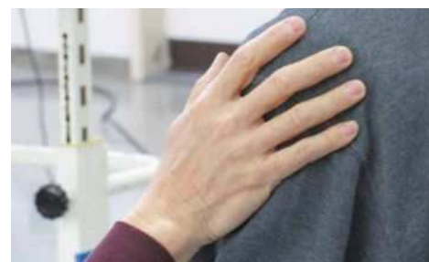
実習・ハンズオン（PT・OTのための土曜教室より）

講演・講義だけではなく、実習やグループワークなど様々な形態で、主体的な学びをサポートします。 開催日程、内容につきましては、当センターHPからご覧ください。 下記サイトからお申込みできます。