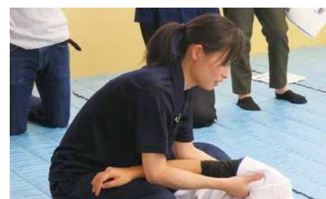
実習・ハンズオン（脊髄損傷のリハビリテーションより）