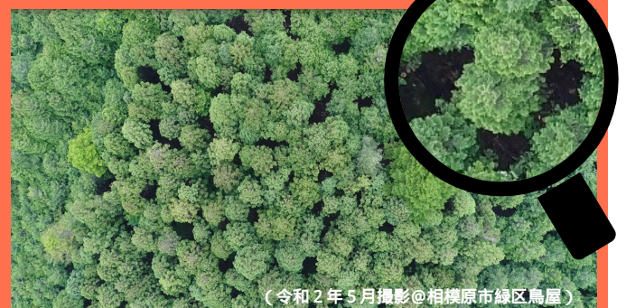
（令和2年5月撮影@相模原市緑区鳥屋）

#陣馬山の山頂付近には自生の#カシワ林があります。#柏餅は、なぜカシワの葉に包むのかご存知ですか。カシワの葉には殺菌作用があるからと言われてます。また、樹皮にはタンニンを多く含んでおり、防水用に使われました。江戸時代には葉や樹皮も売買され、それで年貢を納めた人もいます。