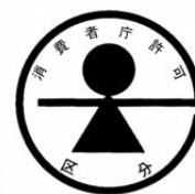
(b) 特別用途食品の標識

以上に述べた(a) 保健機能食品、(a)① 特定保健用食品、(a)② 栄養機能食品、(a)③機能性表示食品、(b)特別用途食品（特定保健用食品を除く。）の規制上の関係を図示すると次表のとおりとなる。