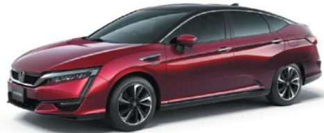
本田技研工業 CLARITY FUEL CELL (クラリティ フューエル セル) 2016年3月から販売開始