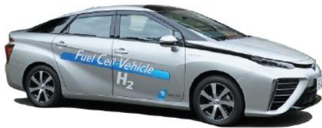
トヨタ自動車MIRAI 2014年12月から販売開始。上の写真は、県公用車です。