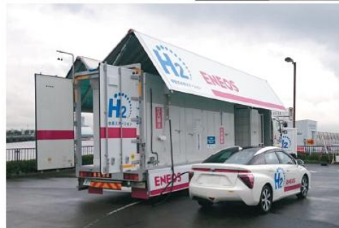
〈移動式水素ステーション〉

2014年12月から、海老名市で営業を開始。 続いて、横浜市旭区、泉区でも営業を開始。