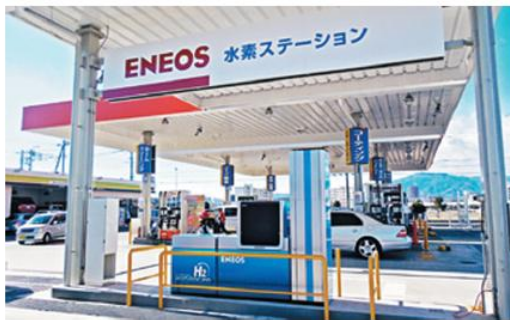
〈固定式水素ステーション〉

2014年12月から、海老名市で営業を開始。 続いて、横浜市旭区、泉区でも営業を開始。