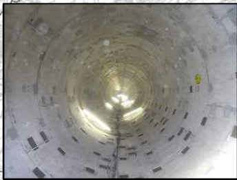
【横浜市】大岡川右岸雨水幹線

○ 令和元年東日本台風では、各地で戦後最大を超える洪水により甚大な被害が発生したことを踏まえ、大岡川水系においても、ハード・ソフト一体となった実効性のある事前防災対策を加速していくために、以下の取組を実施していくことで、既存施設能力を最大限に活用し、年超過確率1/6.3（時間雨量約50mm）の規模の洪水を安全に流下させ、流域における浸水被害の軽減を図る。