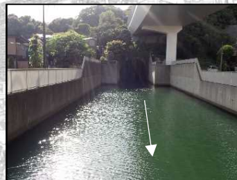
【神奈川県】大岡川分水路出口部