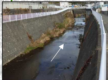
【横浜市】準用河川日野川(完成断面)