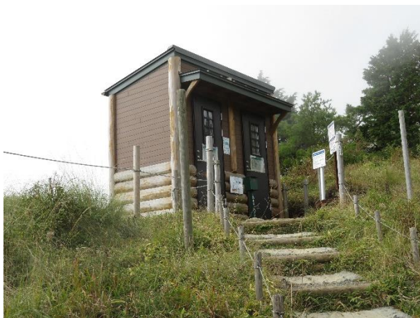
大倉尾根・花立のトイレ

また、トイレ施設の清掃や維持管理のため、一回の使用につき 100 円の協力金を合わせてお願いしております。