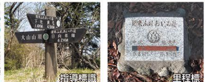
各コースとも、要所に指導標識(写真参照)が設置されています。また工事等で迂回措置がとられる場合もあります。実際の案内標識にしたがって歩いてください。