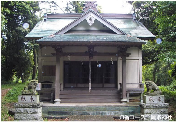
8番コース 鷹取神社