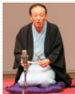
防犯落語(三遊亭遊吉師匠)

県民大会では、約300名の参加者全員で大会宣言を読み上げ、拍手をもって宣言内容にご賛同いただきました。(大会宣言の内容は県ホームページでご覧になれます)