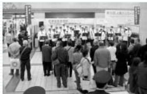
昨年の犯罪被害者週間キャンペーンの様子