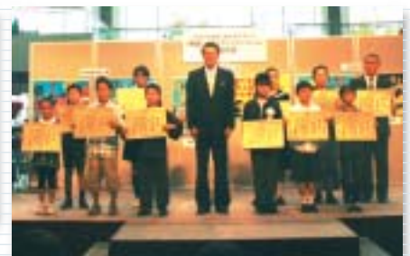
入賞者の皆さんと羽田副知事