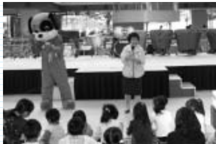
くらし安全指導員による誘拐防止教室