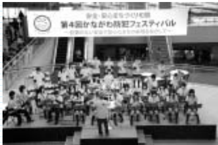
県立金井高校吹奏楽部の演奏