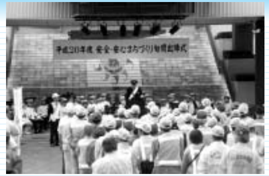
安全・安心まちづくり旬間出陣式の様子

10月10日(金)、海老名中央公園及びビナウォークで旬間出陣式を行い、関係機関や地域の自主防犯団体の協力のもと、県内一斉防犯パトロールの先陣となってパトロールを実施しました。旬間中、県内では延べ約4万4千人の方がパトロールに参加しました。ご協力ありがとうございました。