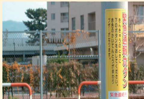
使用方法と連絡先