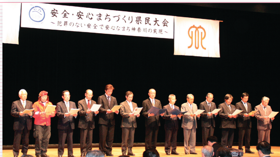
ご参加いただいた皆様一同で大会宣言を読み上げ、盛大な拍手をもって宣言内容にご賛同いただきました。