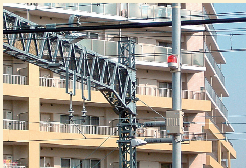
開成駅西口北側に設置された「子ども緊急防犯通報装置」

これは、平成18年に開かれた子ども議会での当時開成小学校6年生だった児童による提案が実現したものです。