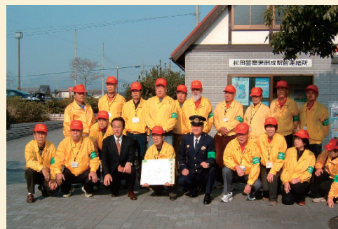
「開成駅前連絡所ボランティア安全サポーター」 感謝状贈呈式後