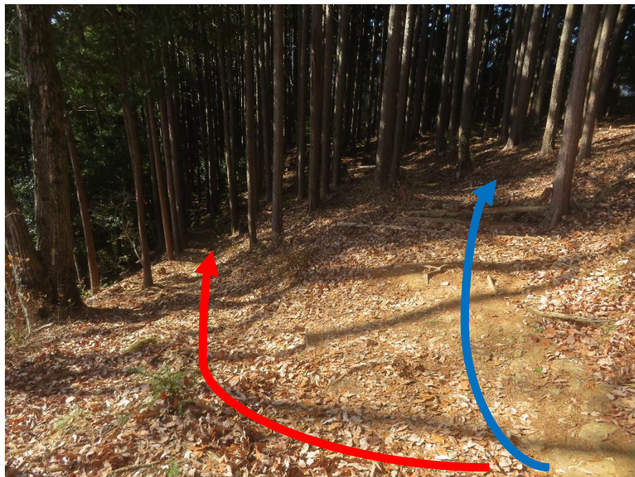
作業道（青線） 登山道（赤線）