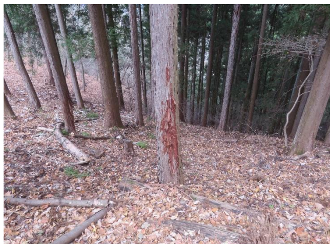
真新しい樹皮剥ぎの跡（登山道沿いに多く目立っている）