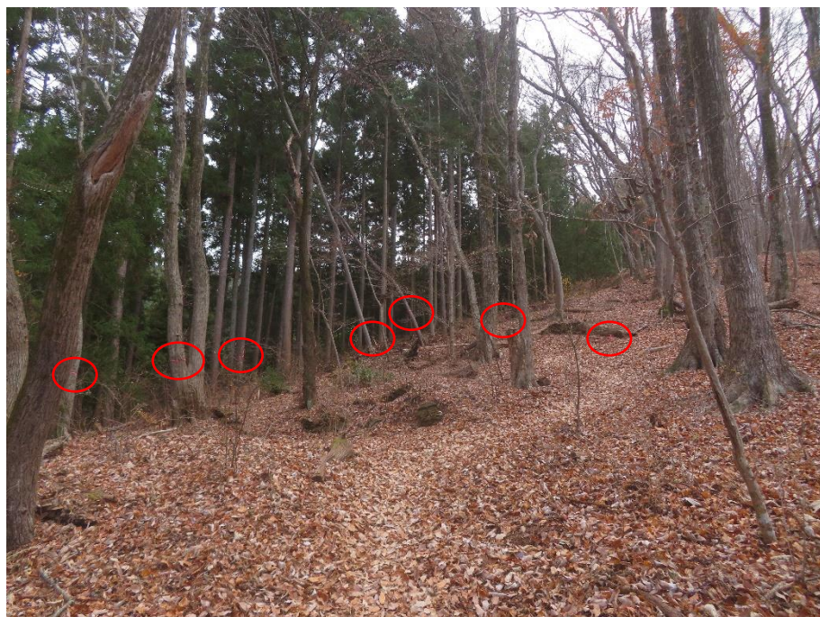
作業道についているピンクの目印テープ（赤丸）