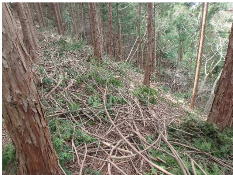
間伐直後の様子（2016年3月撮影）

●篠原側登山口周辺は植林の森です。以前はうっそうとしていましたが、8年前に間伐と枝打ちが行われ現在は下草も茂り明るい森になりました。