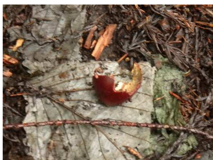
食痕のあるクリの実