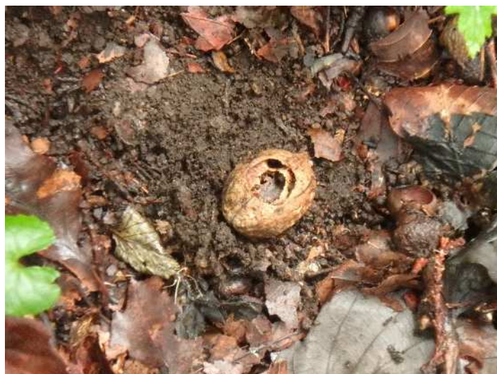
アカネズミの食痕があるオニグルミ